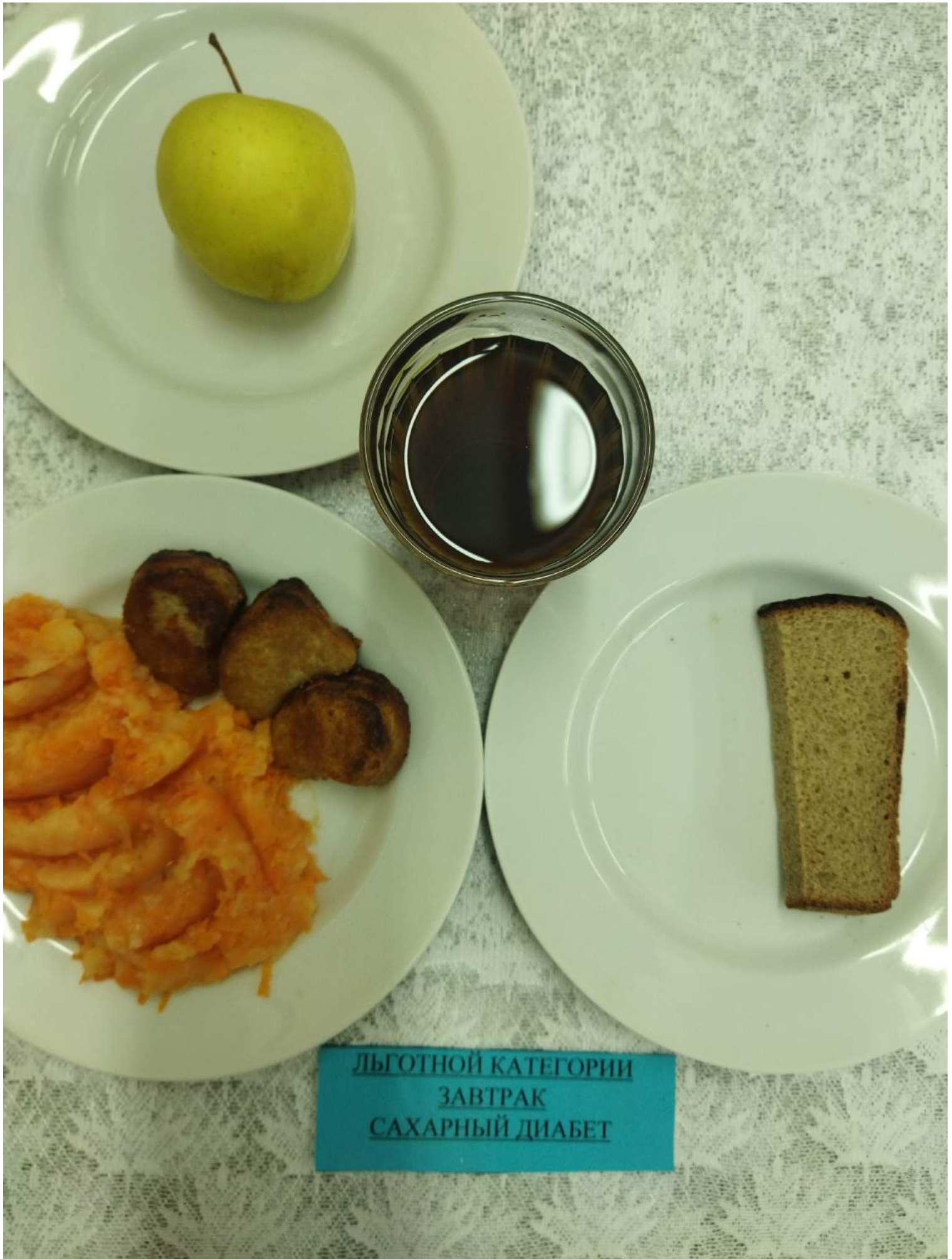
Льготной категории завтрак сахарный диабет