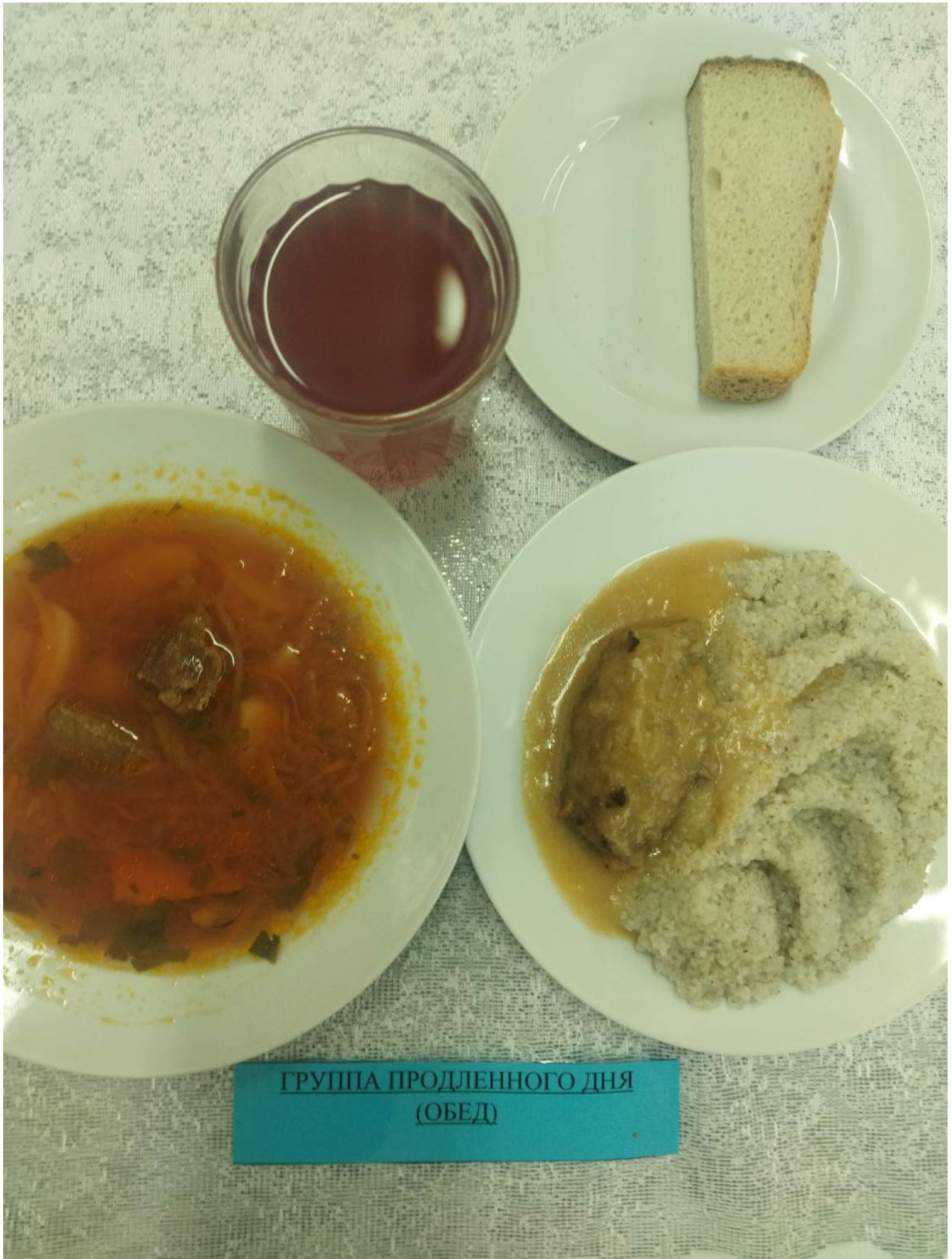
ГРУППА ПРОДЛЕННОГО ДНЯ (ОБЕД)