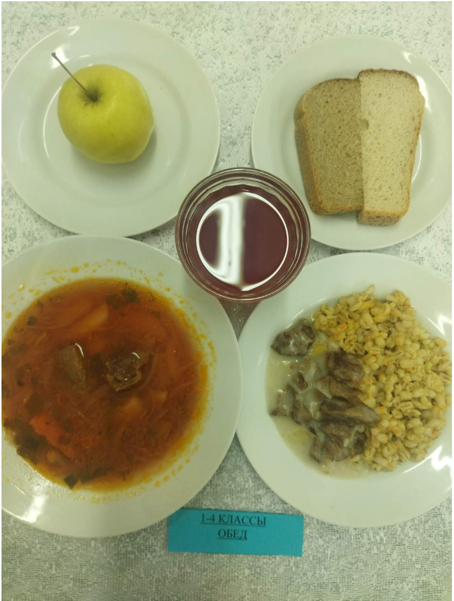
1-4 КЛАССЫ ОБЕД