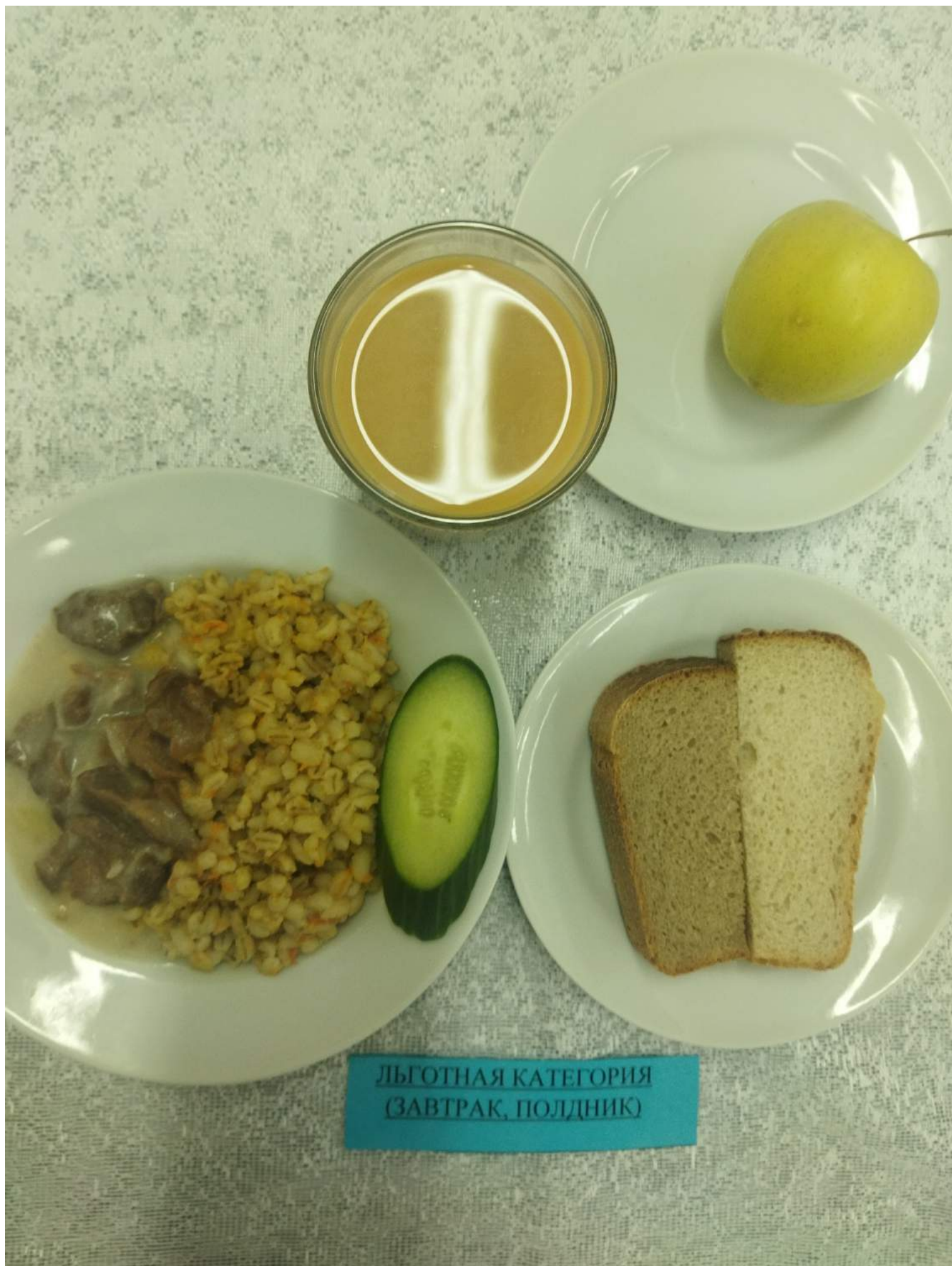
Льготная категория (Завтрак, полдник)