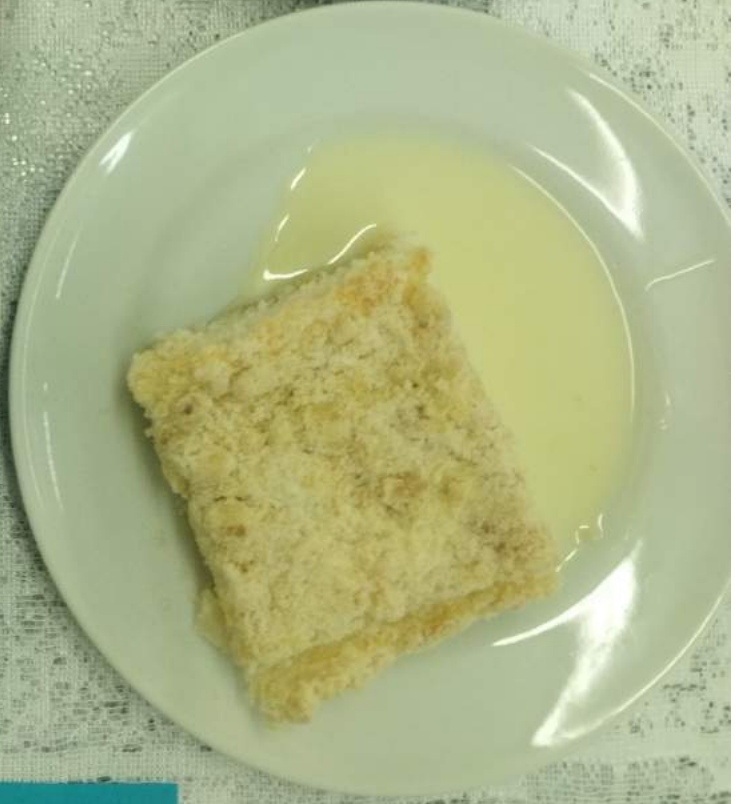
1-4 КЛАССЫ ЗАВТРАК