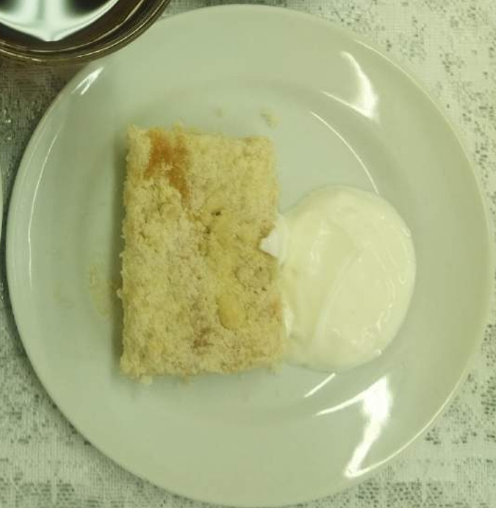
Льготной категории Завтрак Сахарный диабет