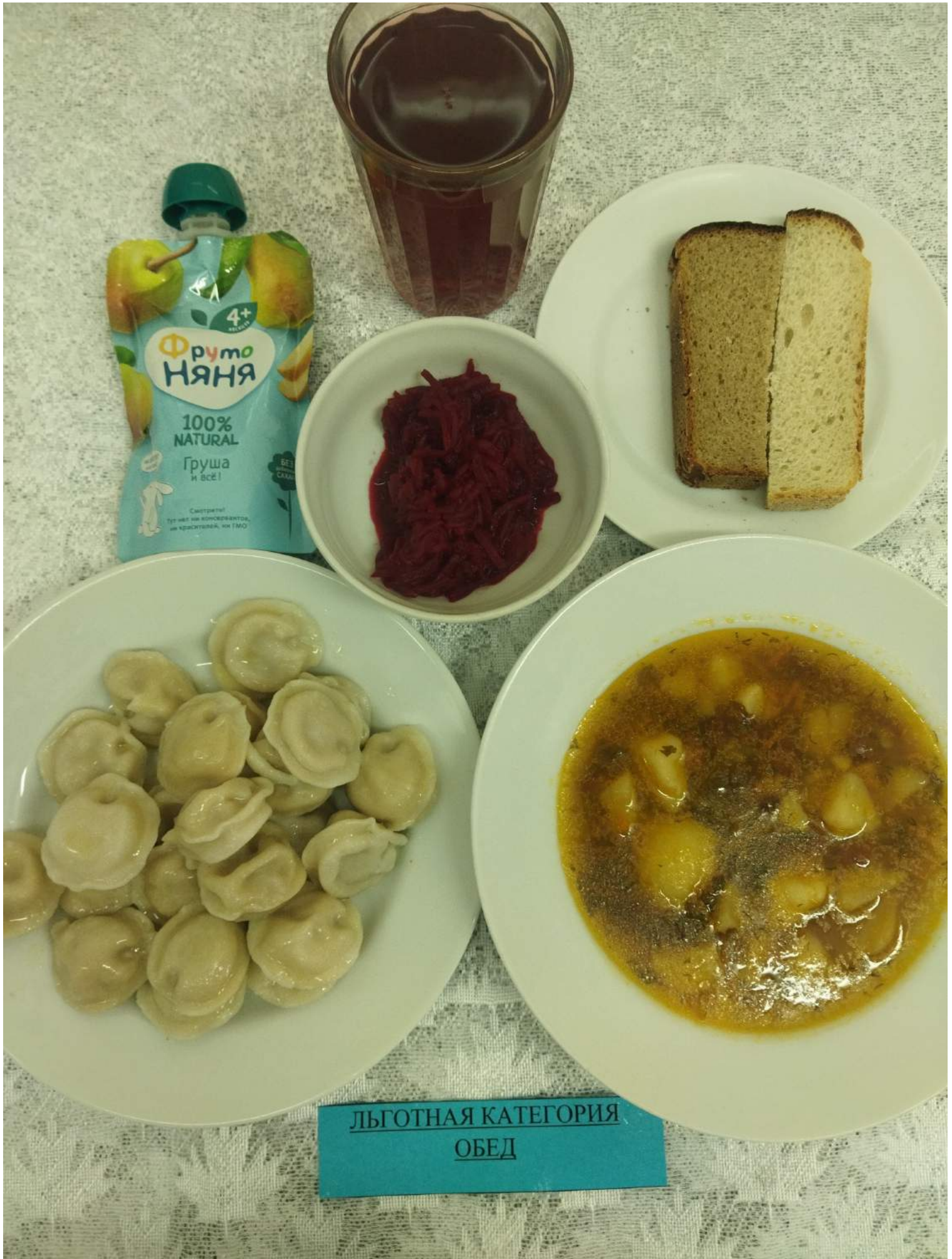
Льготная категория Обед