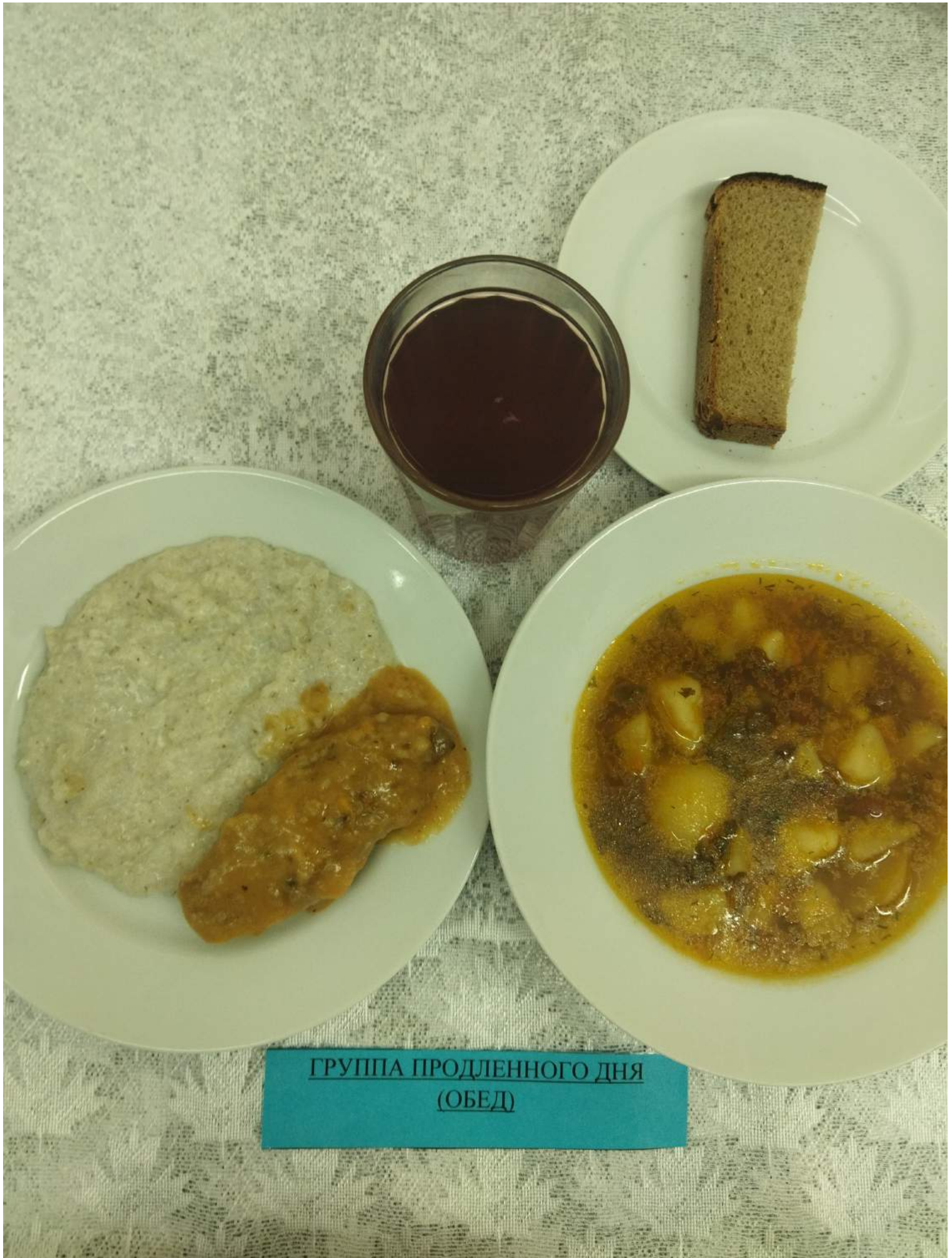
ГРУППА ПРОДЛЕННОГО ДНЯ (ОБЕД)