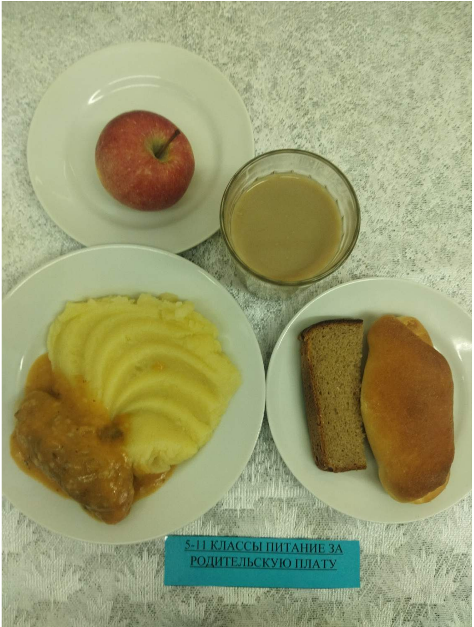
5-11 КЛАССЫ ПИТАНИЕ ЗА РОДИТЕЛЬСКУЮ ПЛАТУ