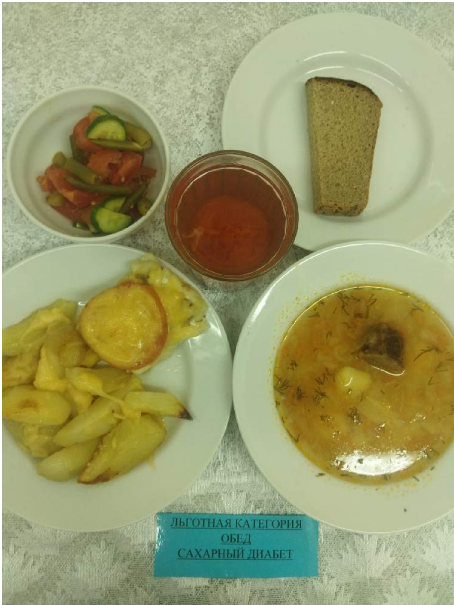
Льготная категория Обед Сахарный диабет