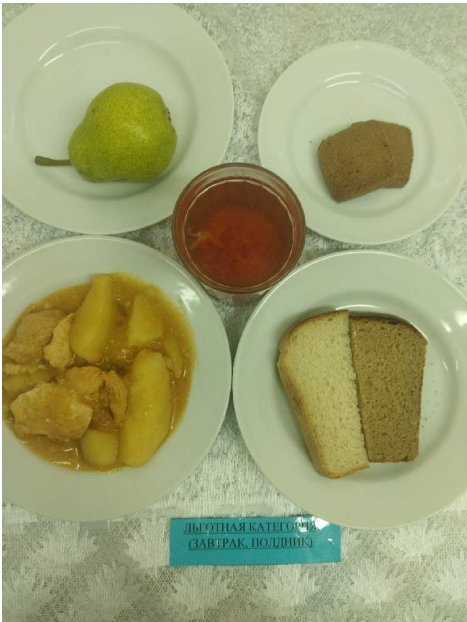
Льготная категория (Завтрак, полдник)