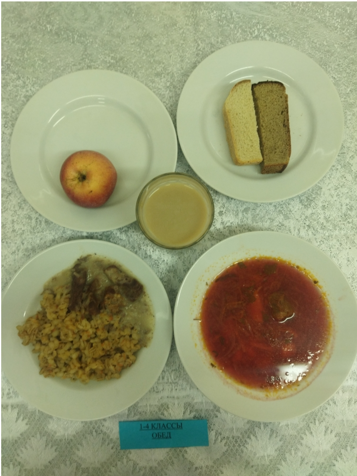
1-4 КЛАССЫ ОБЕД