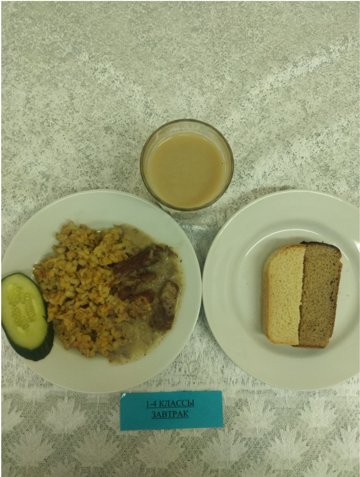
1-4 КЛАССЫ ЗАВТРАК