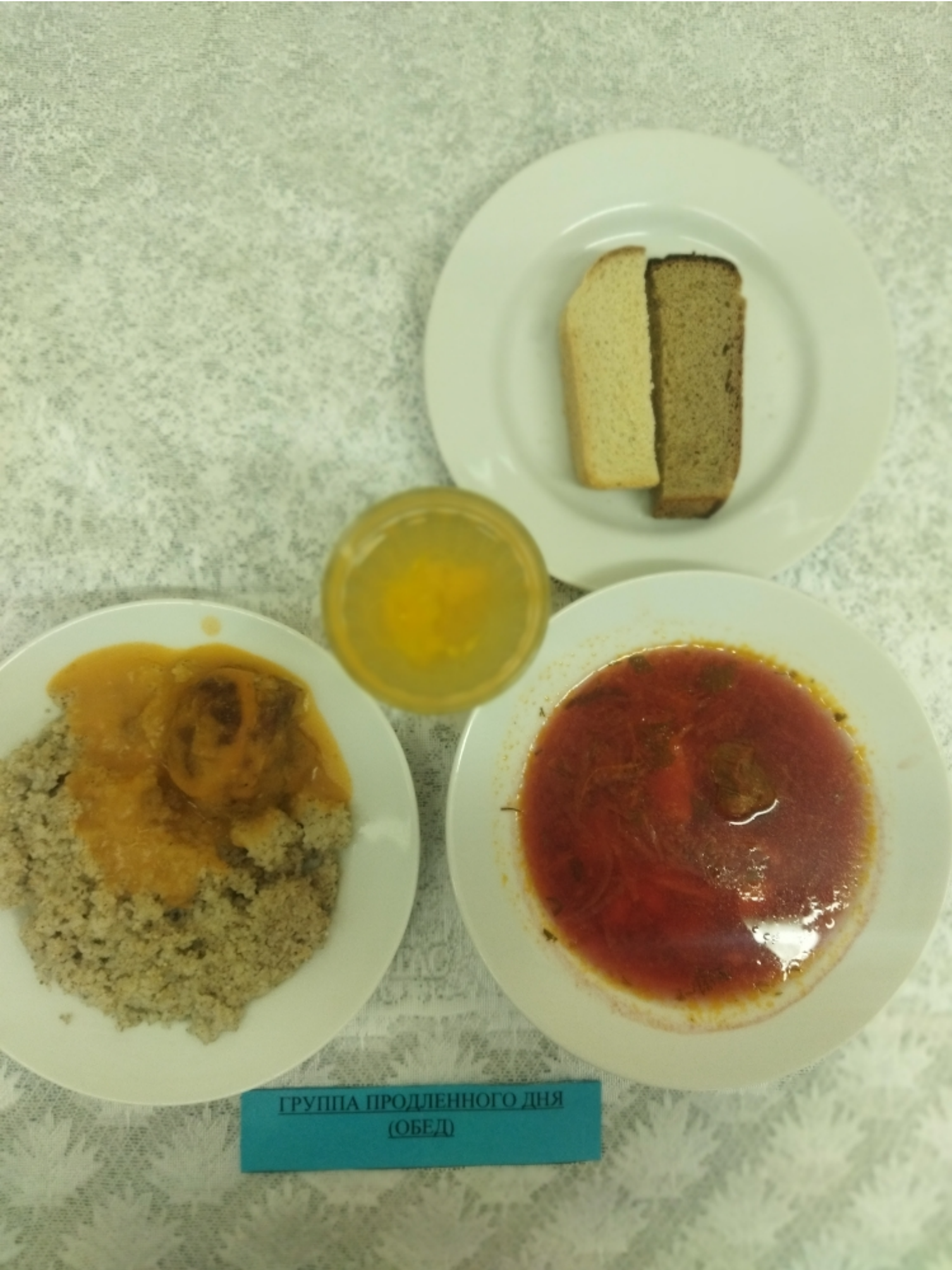
ГРУППА ПРОДЛЕННОГО ДНЯ (ОБЕД)