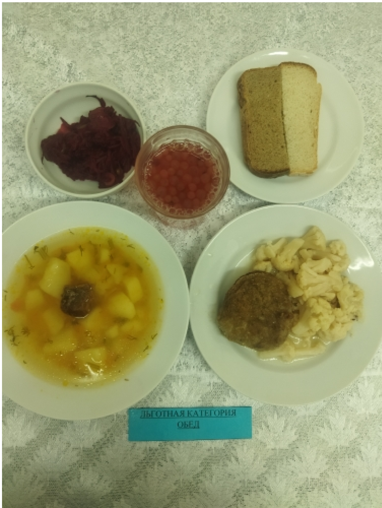
ПРИВИЛЕГИРОВАННАЯ КАТЕГОРИЯ ОБЕД