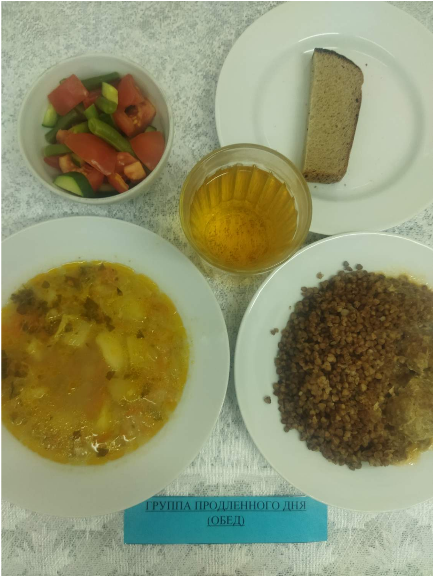
ГРУППА ПРОДЛЕННОГО ДНЯ (ОБЕД)