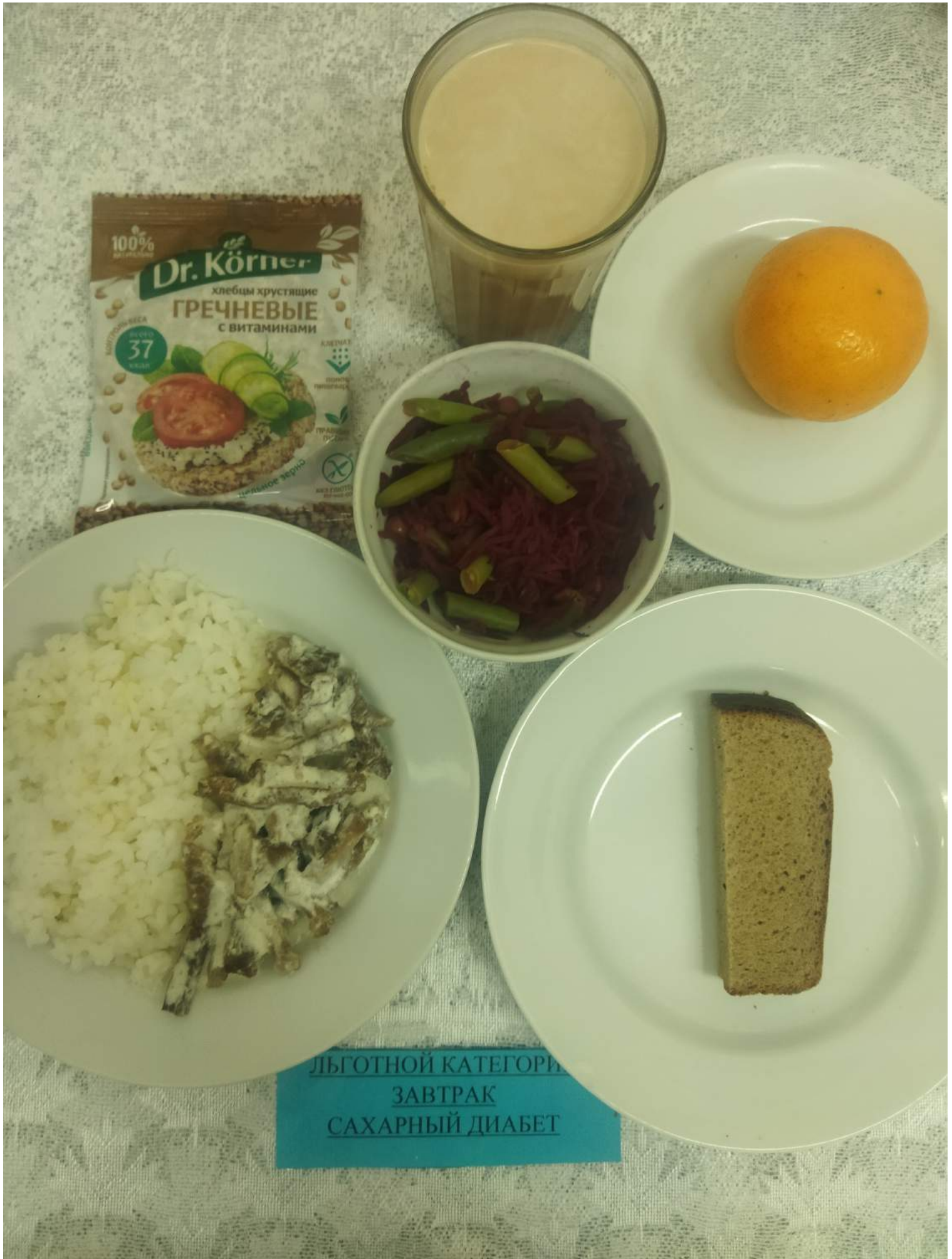
Льготной категории ЗАВТРАК САХАРНЫЙ ДИАБЕТ