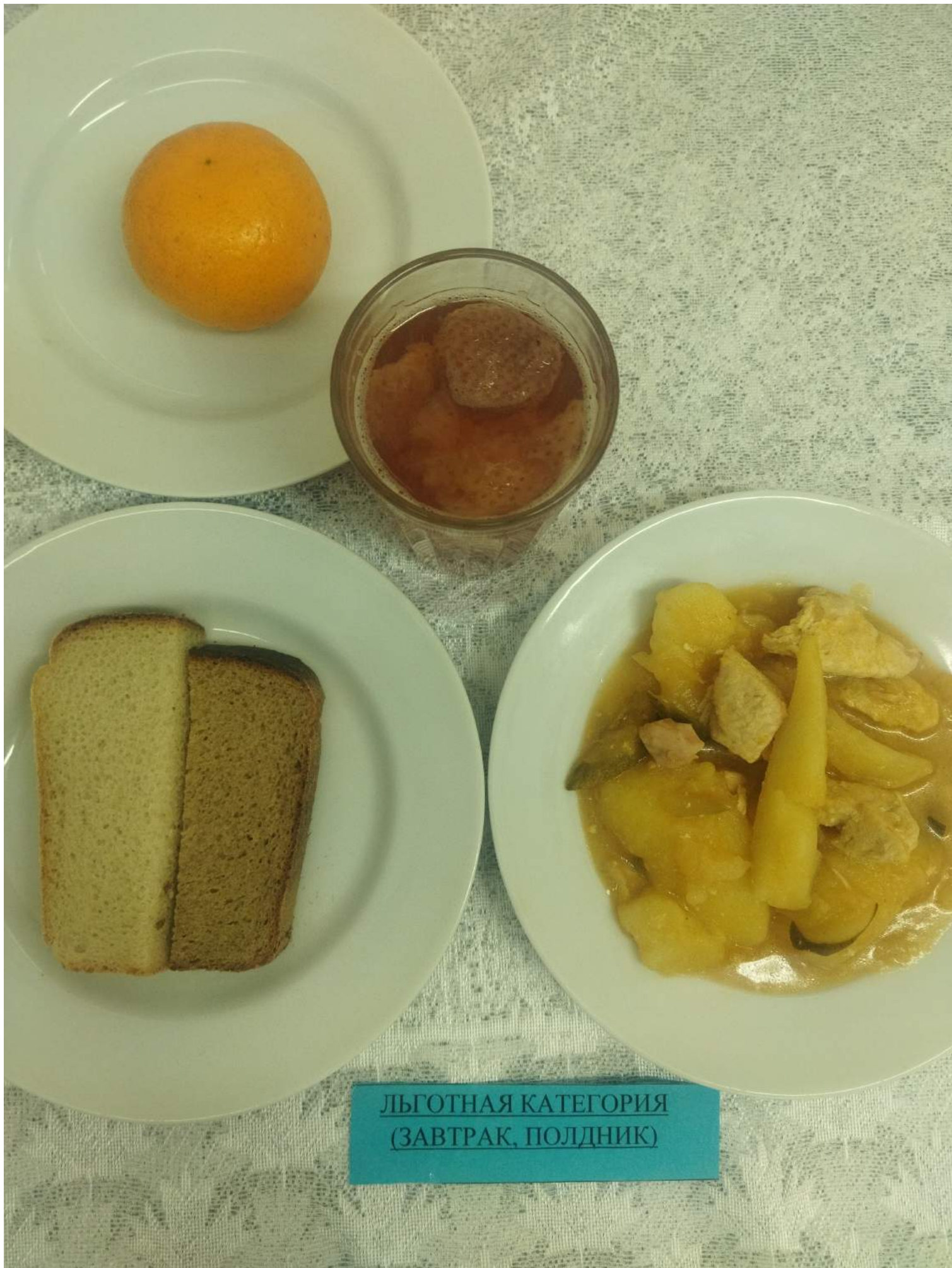
Льготная категория (Завтрак, полдник)