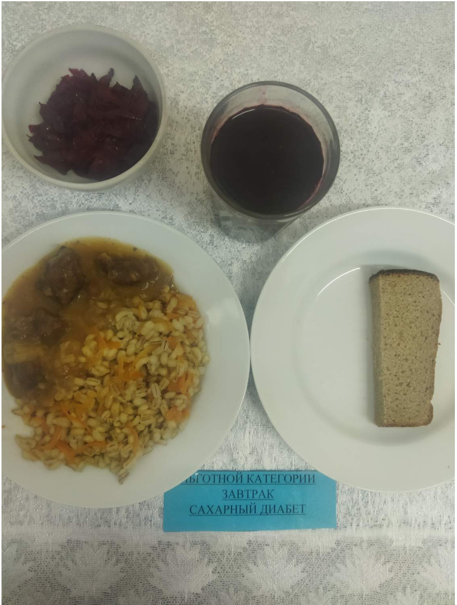
СРЕДНЕЙ КЛАССОВОЙ КАТЕГОРИИ ЗАВТРАК САХАРНЫЙ ДИАБЕТ