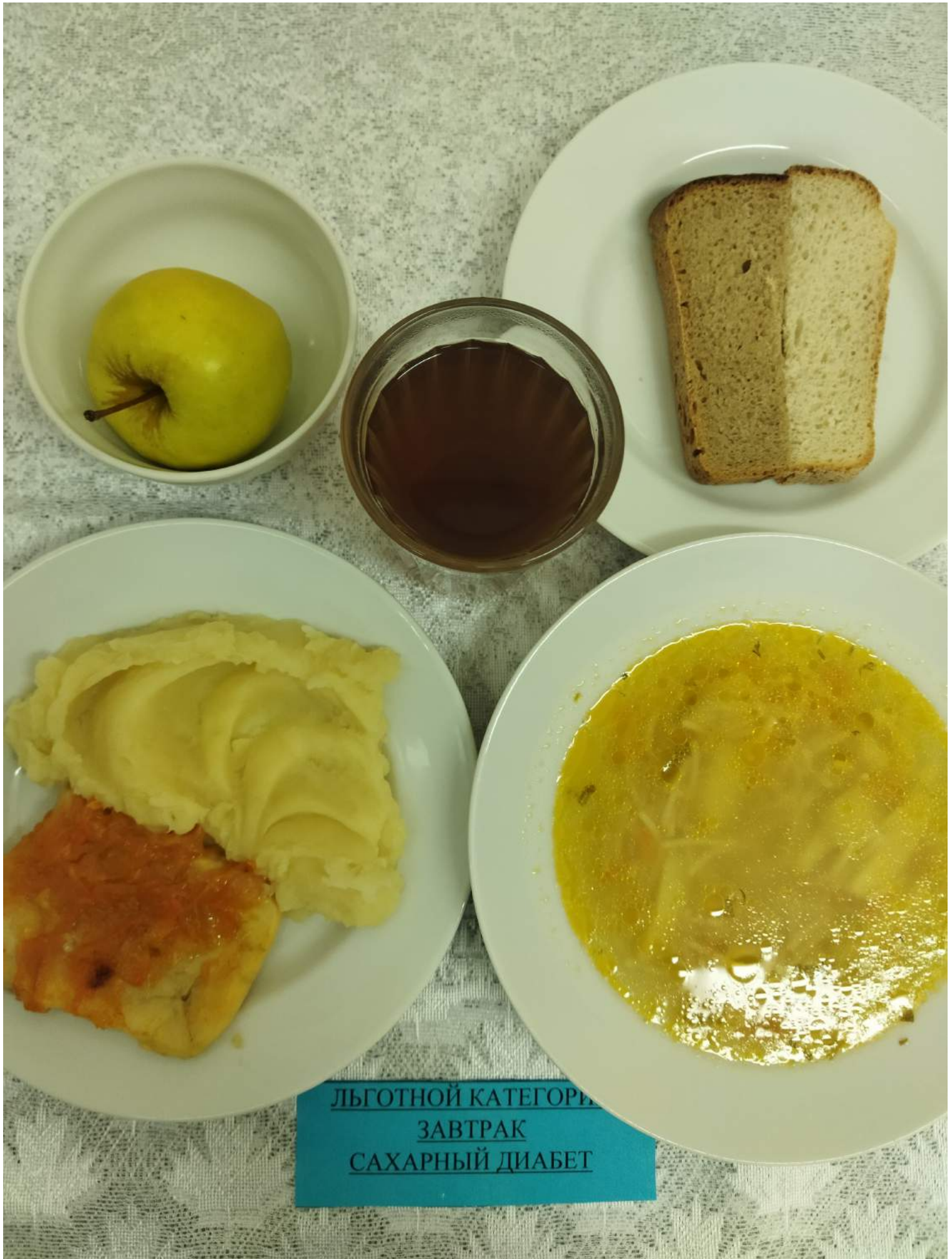
Льготной категории Завтрак Сахарный диабет