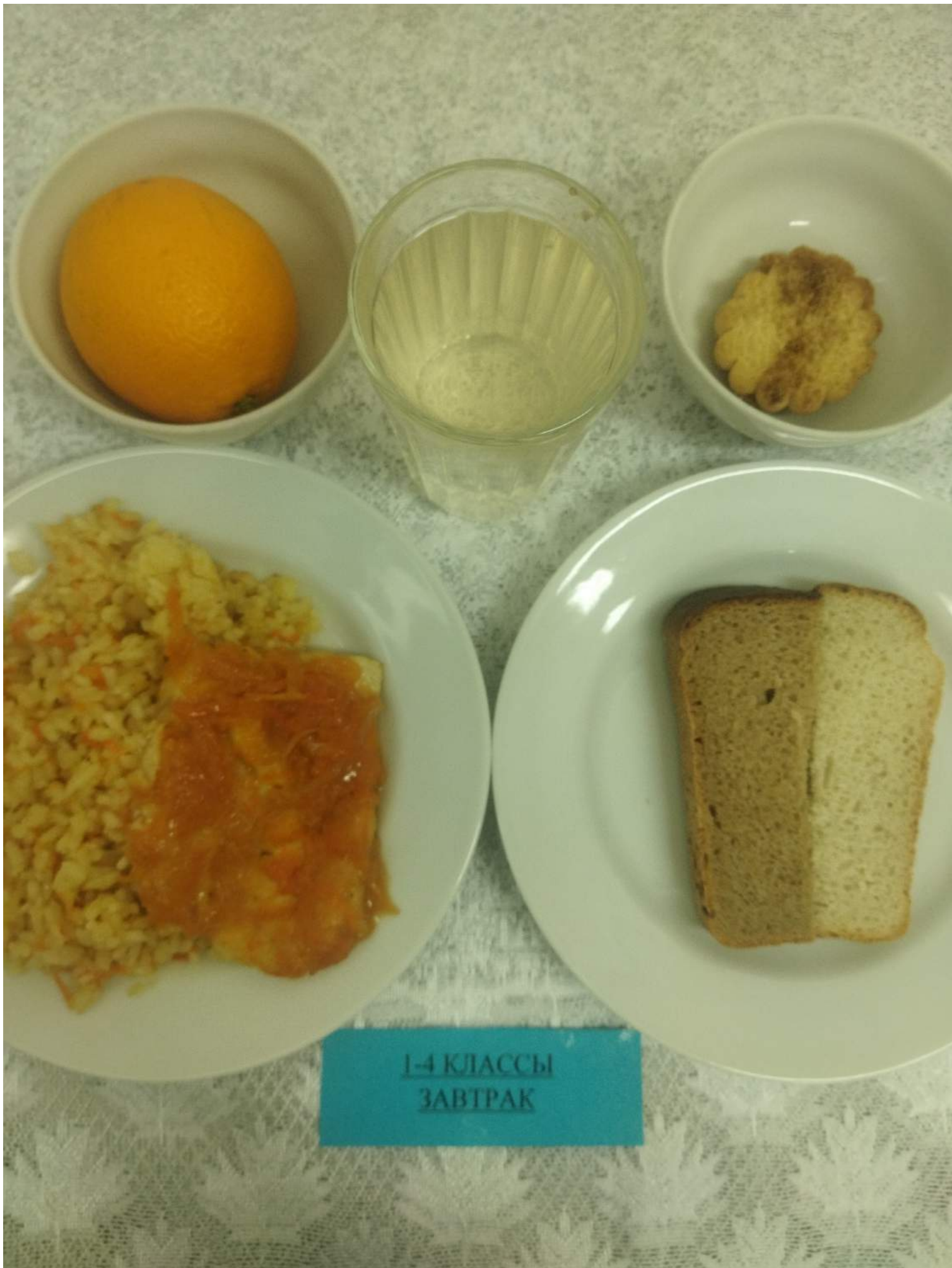
1-4 КЛАССЫ ЗАВТРАК