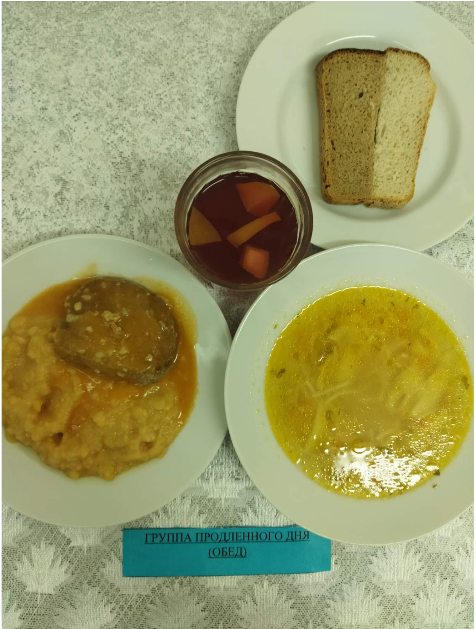
ГРУППА ПРОДЛЕННОГО ДНЯ (ОБЕД)