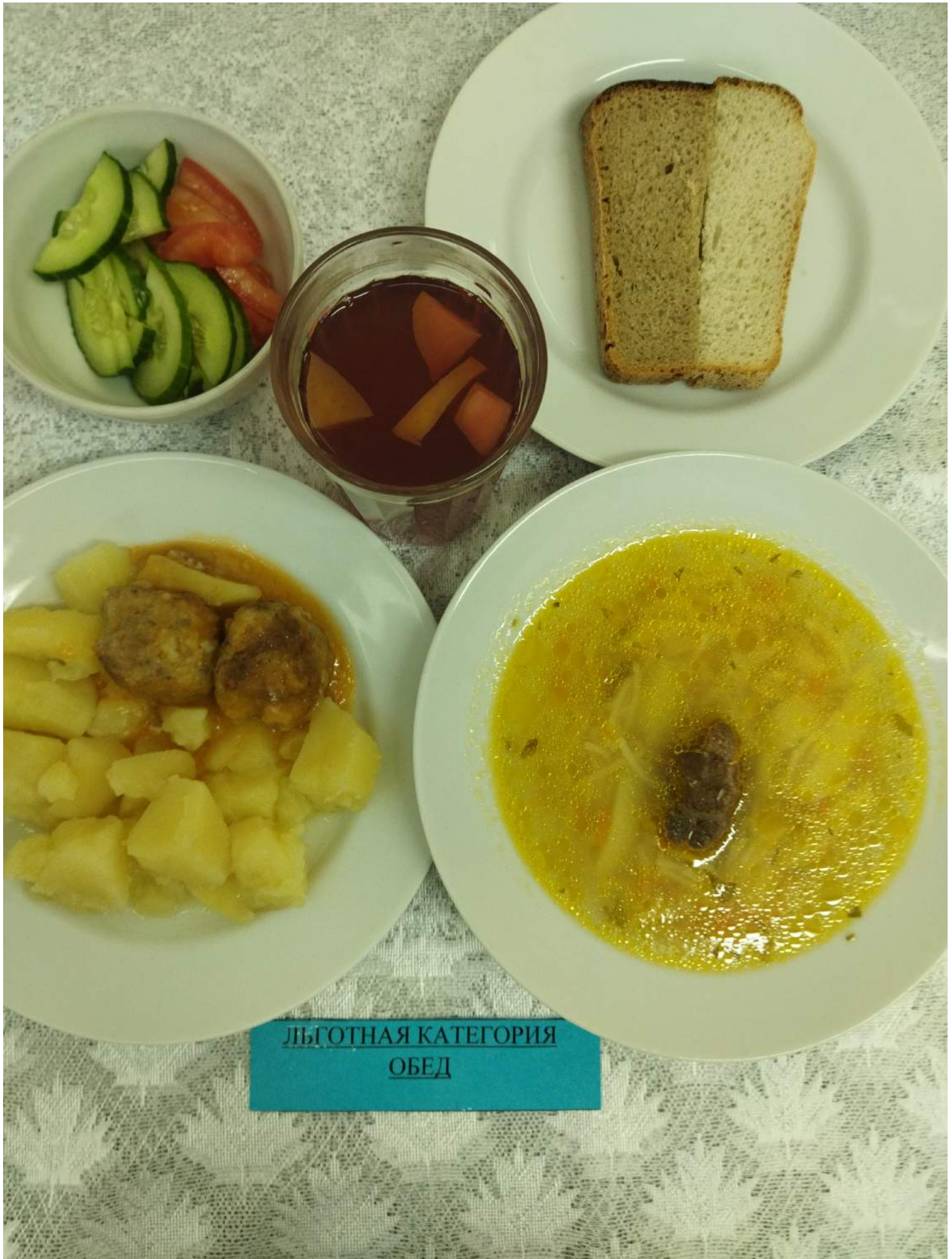
ЛЬГОТНАЯ КАТЕГОРИЯ ОБЕД