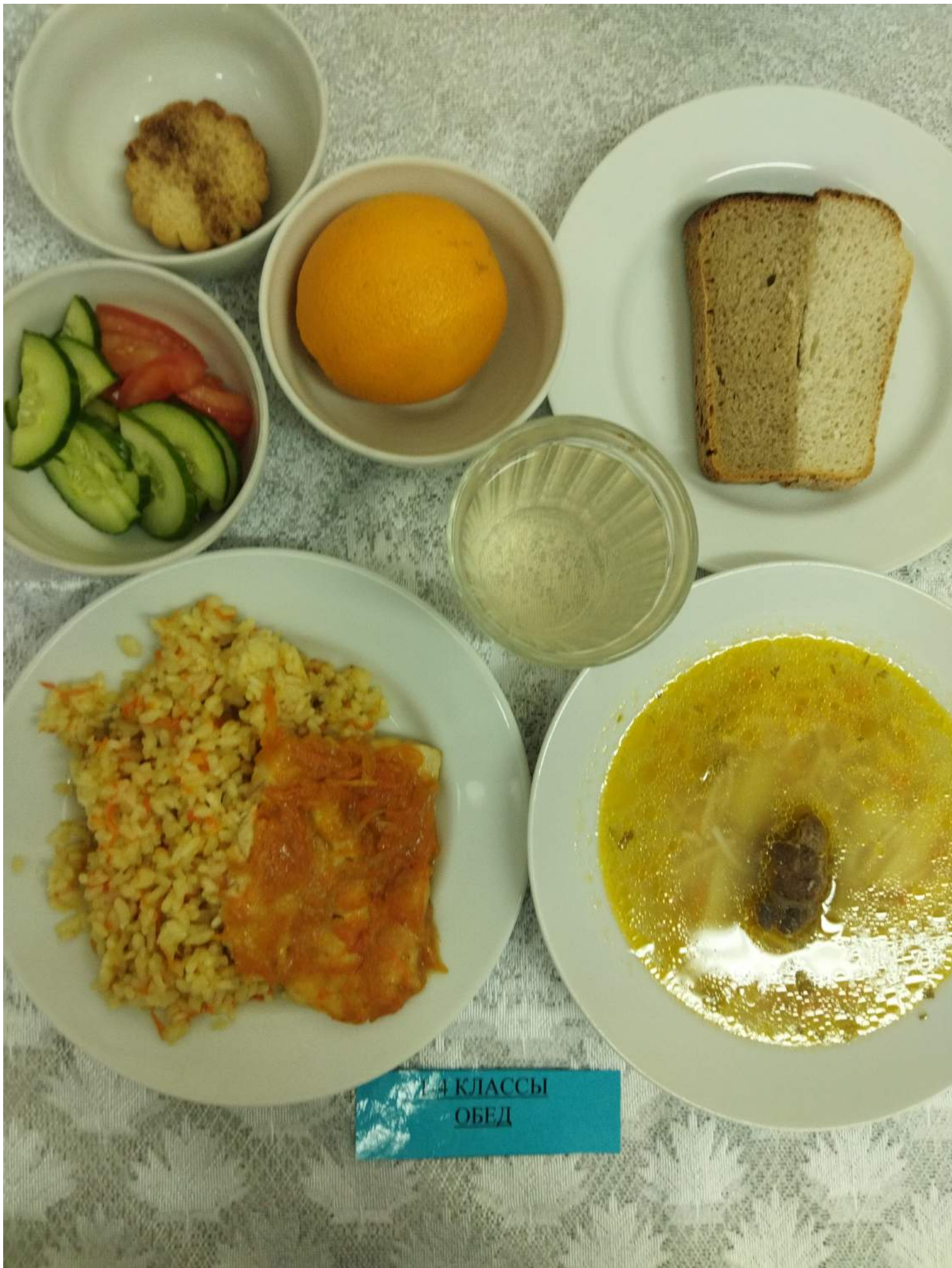
1 А КЛАССЫ ОБЕД