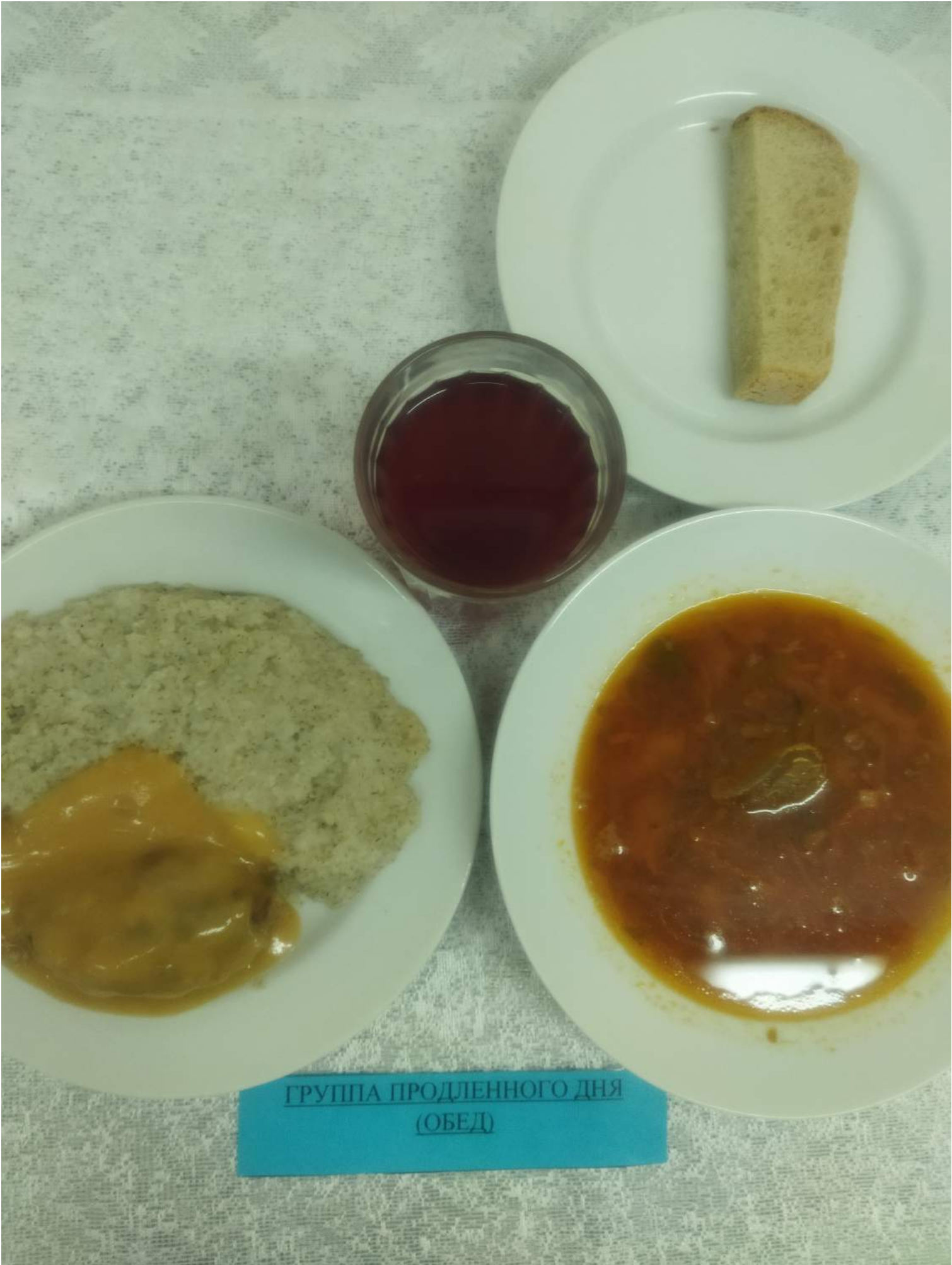
ГРУППА ПРОДЛЕННОГО ДНЯ (ОБЕД)