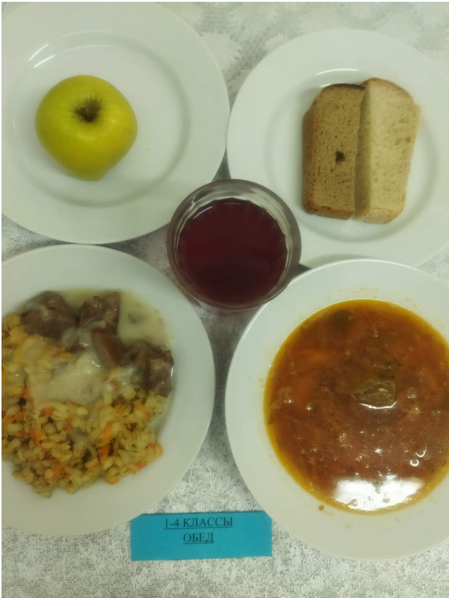
1-4 КЛАССЫ ОБЕД