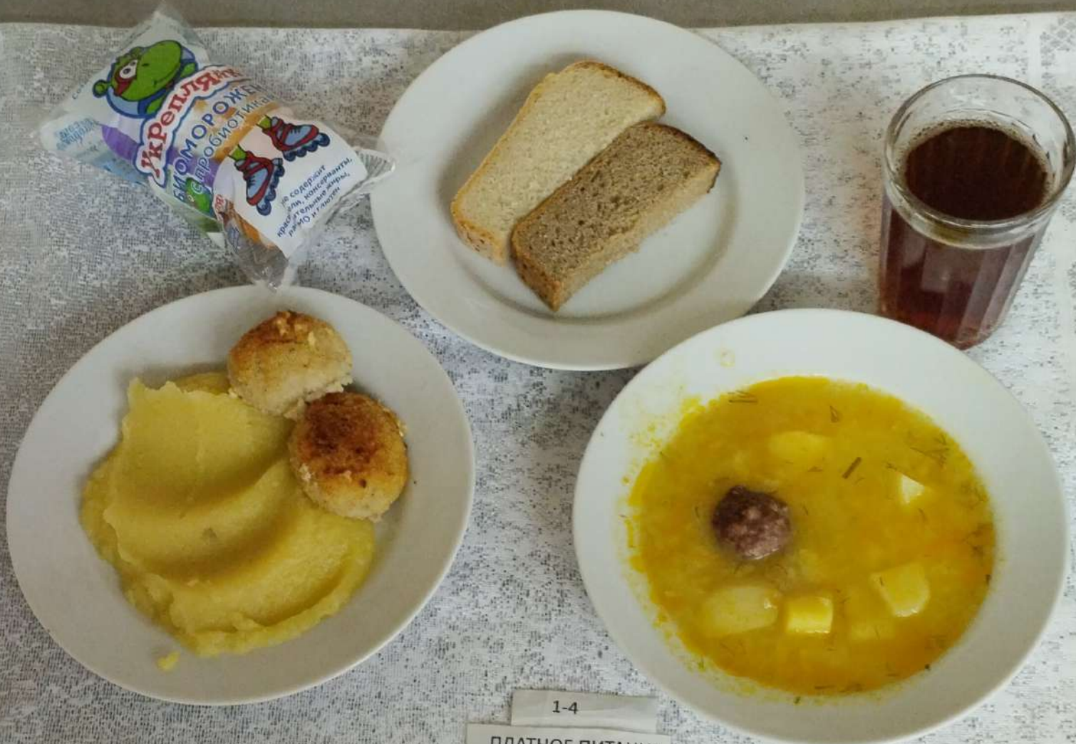
1-4 ПЛАТНОЕ ПИТАНИЕ