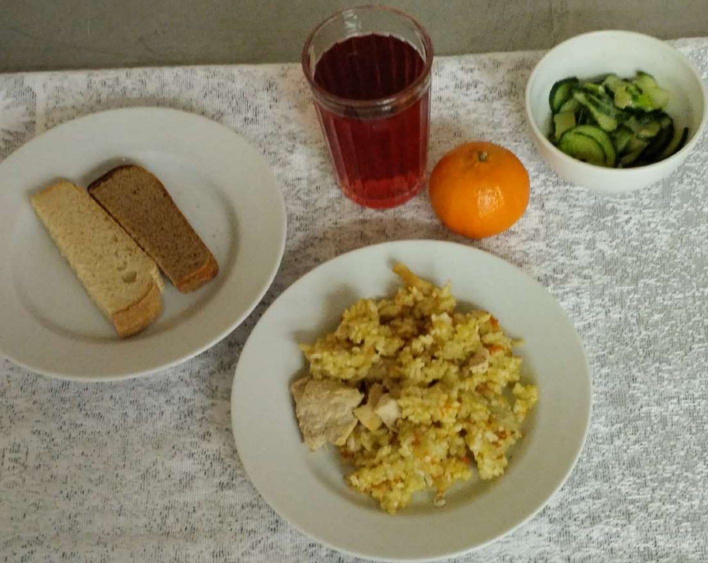
ДЬГОТНОЙ КАТЕГОРИИ ЗАВТРАК