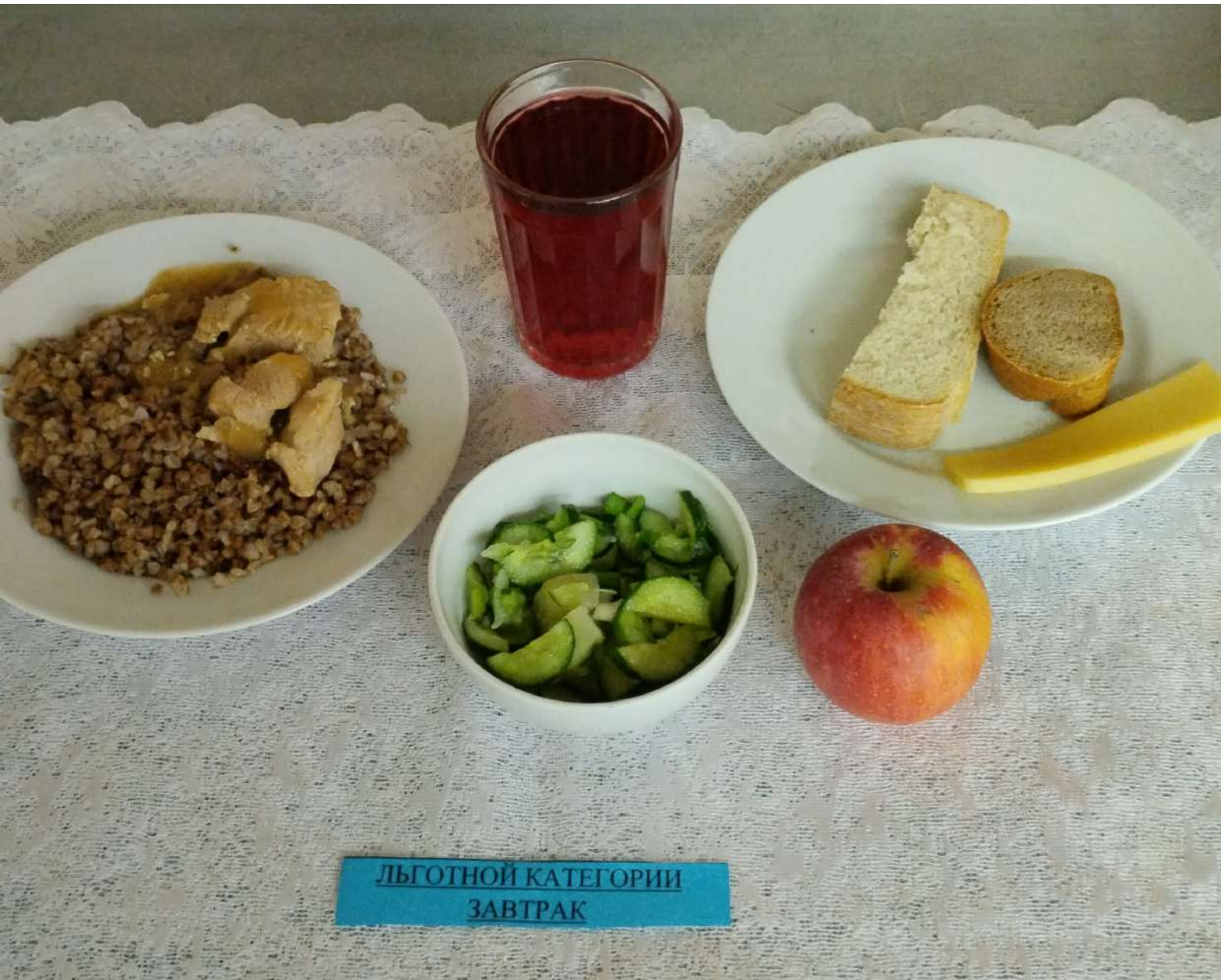
Льготной категории завтрак