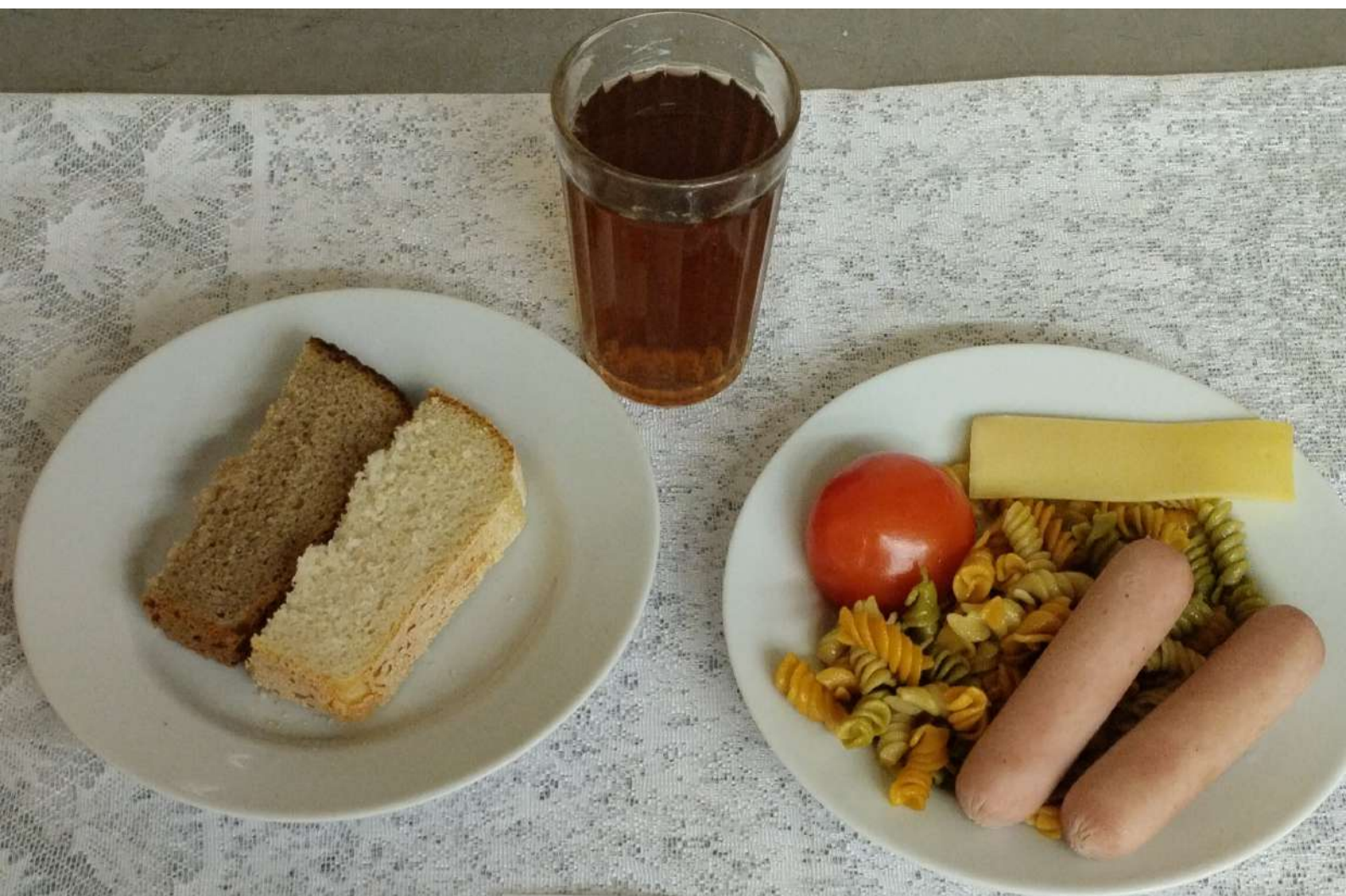
1-4 ЗАВТРАК ПЛАТНОЕ ПИТАНИЕ