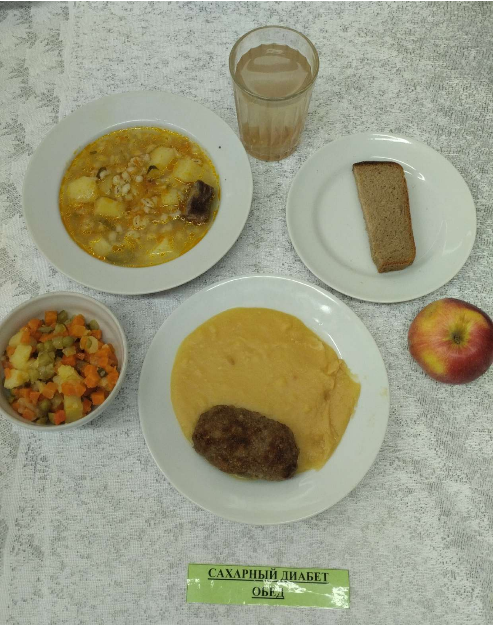
САХАРНЫЙ ДИАБЕТ ОБЕД