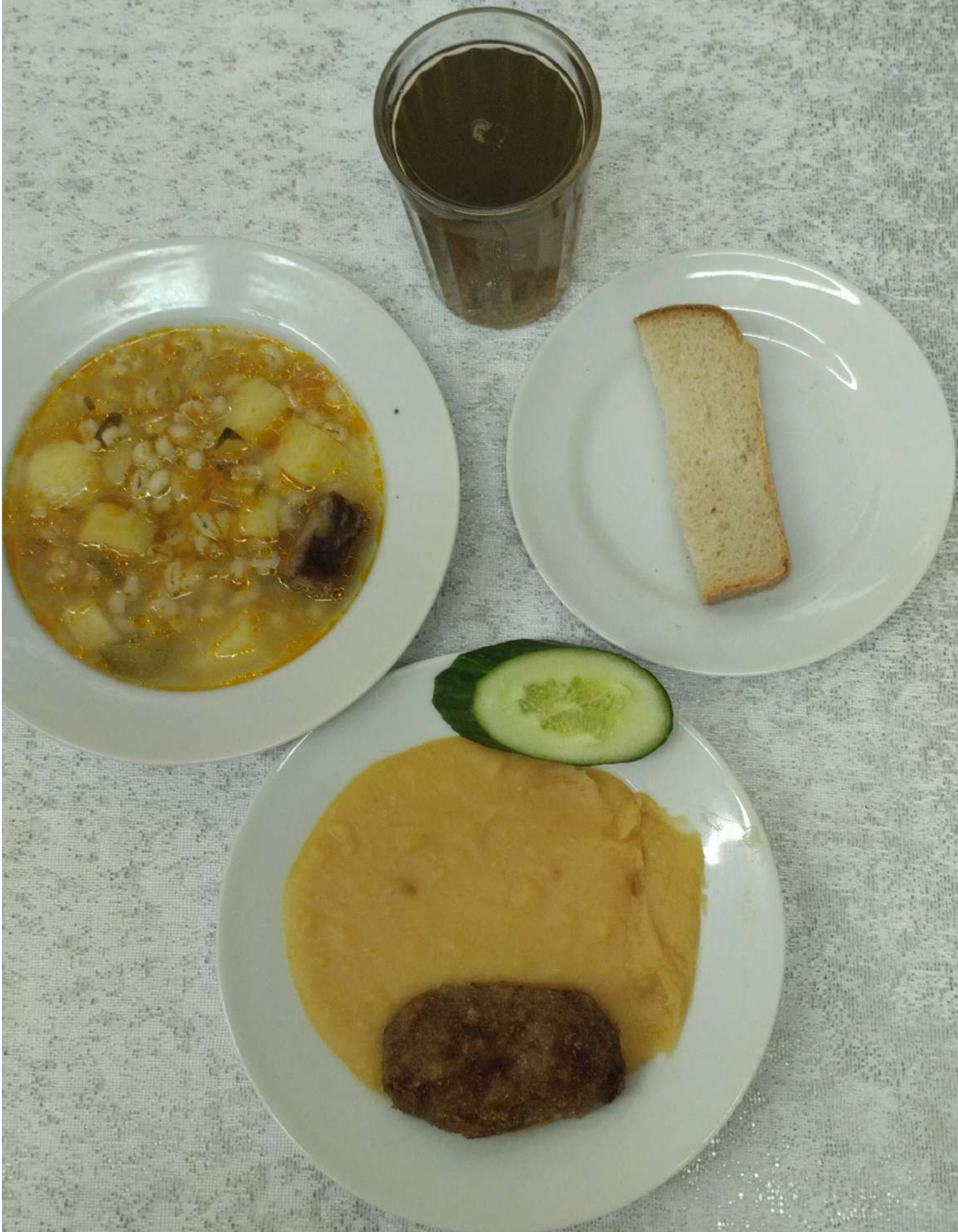
ГРУППА ПРОДЛЕННОГО ДНЯ (ОБЕД)