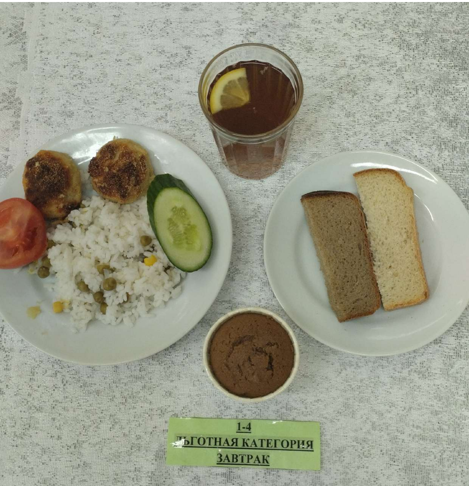
1-4 ПЬОТНАЯ КАТЕГОРИЯ ЗАВТРАК