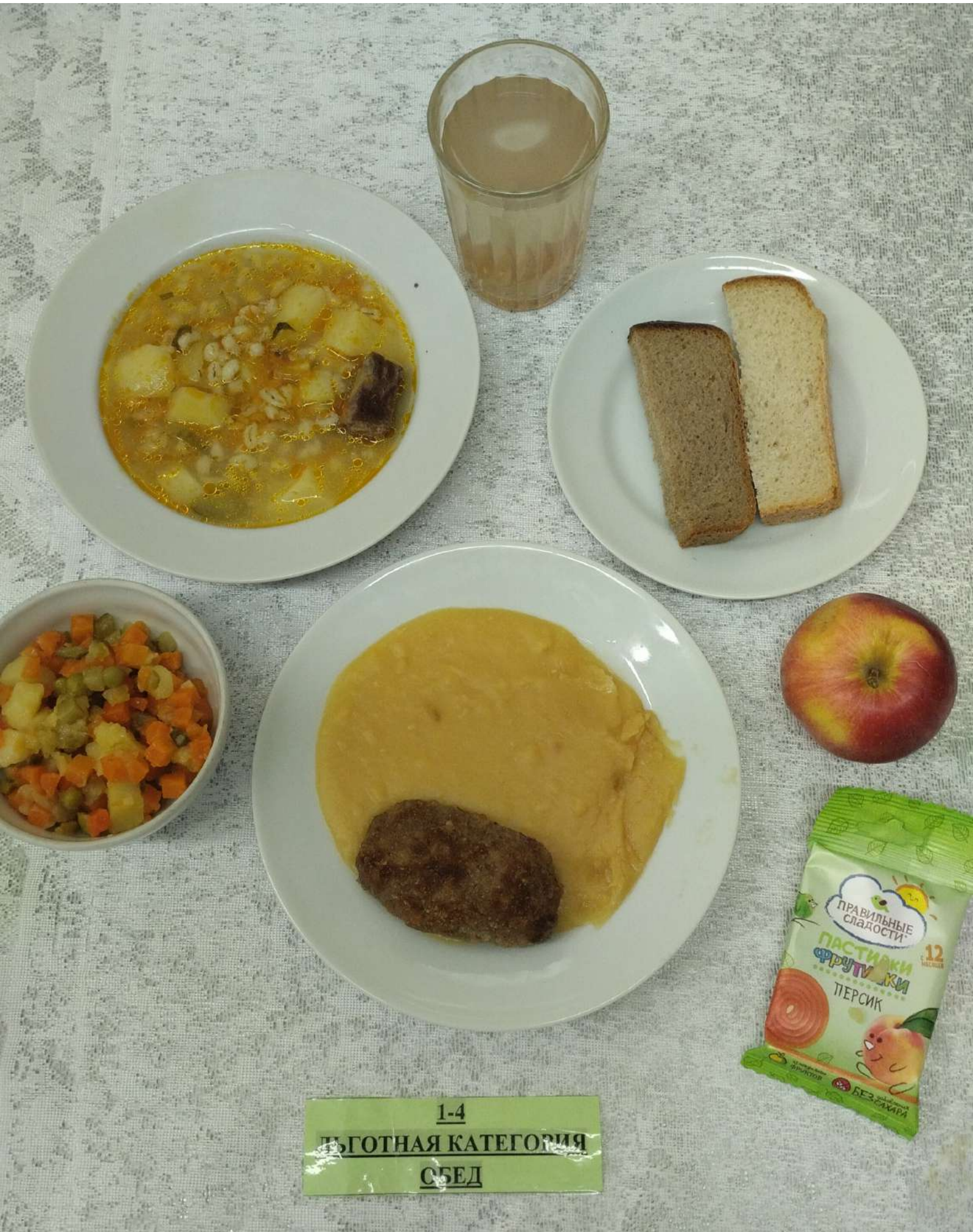
1-4 ПОГОТНАЯ КАТЕГОРИЯ СБЕД